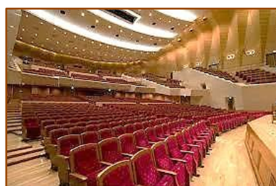
右側座席最前列よりの眺め